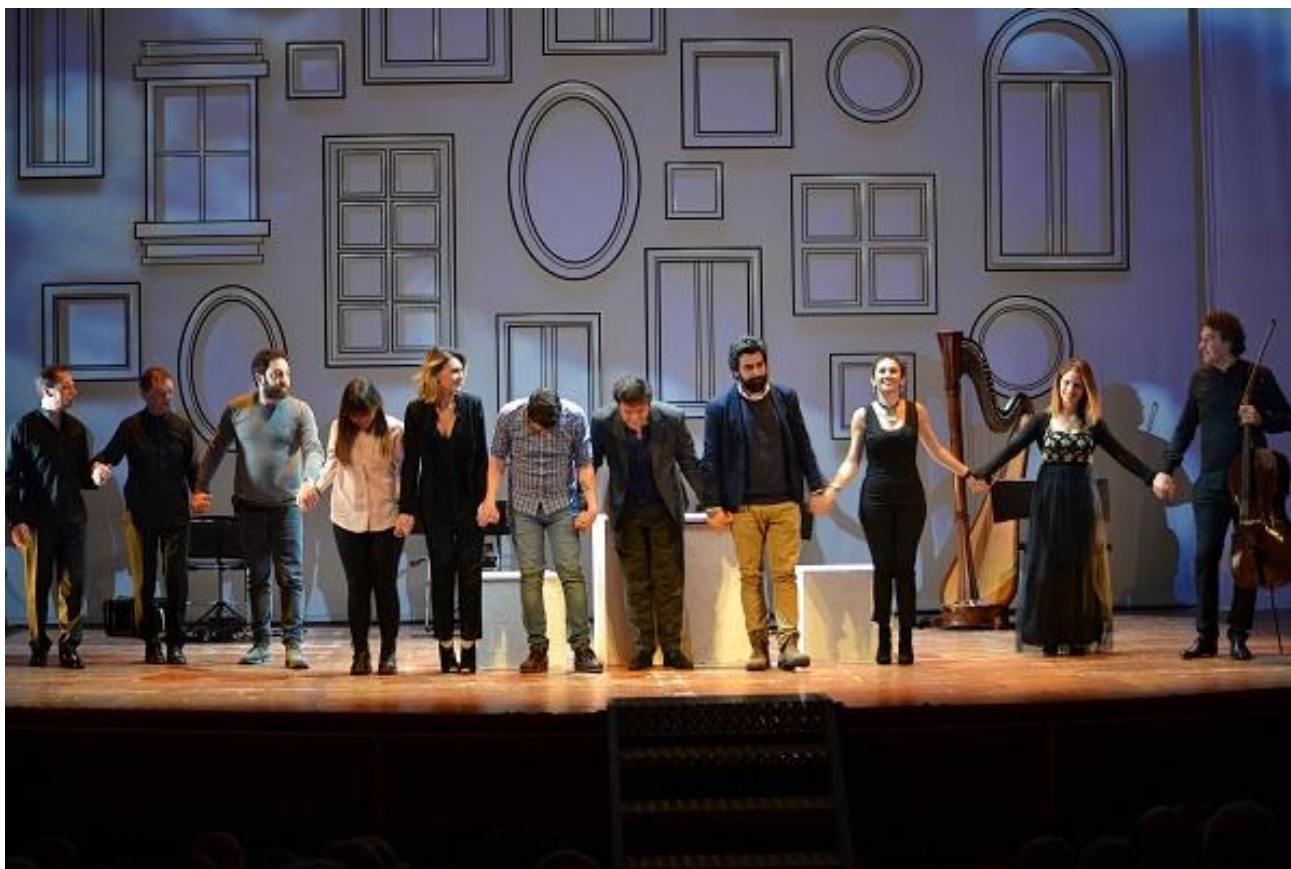
Foto dello spettacolo realizzato presso il Teatro "U. Giordano" di Foggia l'11/03/2018.

Spettacolo coprodotto con l'Associazione socioculturale Spazio Musica